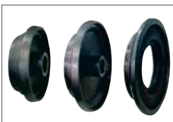
Gruppo coni centraggio ruote da autocarri Set of cones for truck wheel centering