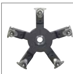
Flangia TRILEX Flange TRILEX