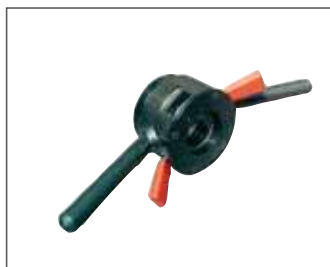
Ghiera rapida fissaggio ruote Quick ring nut for securing wheel