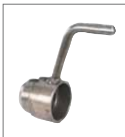
Ghiera fissaggio ruote Ring nut for securing wheel