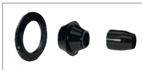
Accessorio base di centraggio per ruote auto Basic centering accessory for car wheel